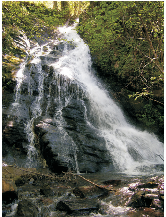
Pincheira de Ferramulín