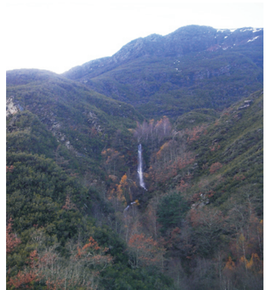
Cavorca da Ferverza Grande