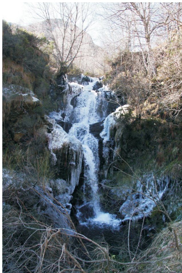
Pincheira do Murelos