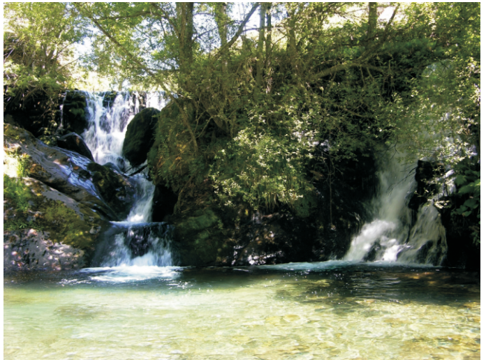
Muíño da Cavorca