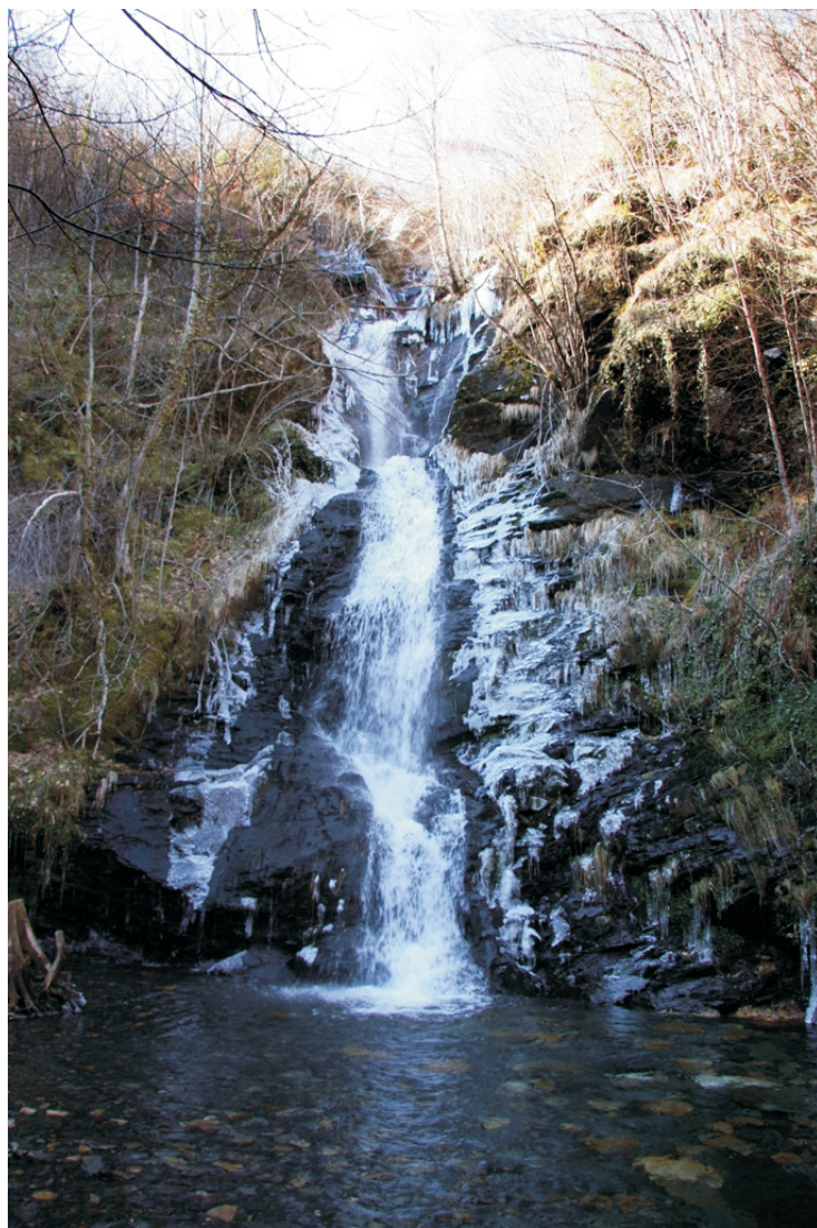
Pincheira de Fócaro

Na ruta da Seara á lagoa de Lucenza, aos 2 km, vese ao lonxe e pódese achegar a ela por un carreiro. Hai outras máis abaixo, preto da de Navaregas.